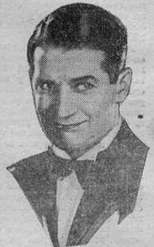
MAURICE CHEVALIER in "The Big Pond" & "The Picture"

EL GRAN CHARCO se dará a precios popularísimos cincuenta céntimos la entrada para que nadie se quede sin admirar esa maravilla.