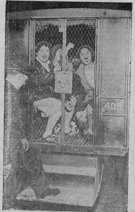
Mil quinientos comunistas, llevando estandartes en Nueva York golpearon a la policía, gritaron imprecaciones y dispararon un tiro. Finalmente muchos fueron arrestados. Aquí aparecen algunas mujeres comunistas dentro de un carro de la policía gritando galanterías a los policías y fotógrafos