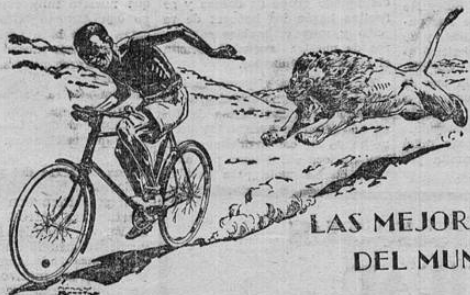
LAS MEJORES DEL MUNDO

Hemos recibido los modelos 1931 para hombre y mujer Precioso surtido para niños desde cuatro años de edad ABIERTO HASTA LAS 10 p. m