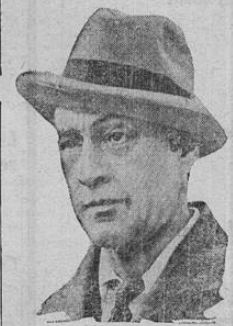
John Barrymore, el artista de la pantalla, se informa que se encuentra enfermo a bordo de su yate privado, "Guatemala"